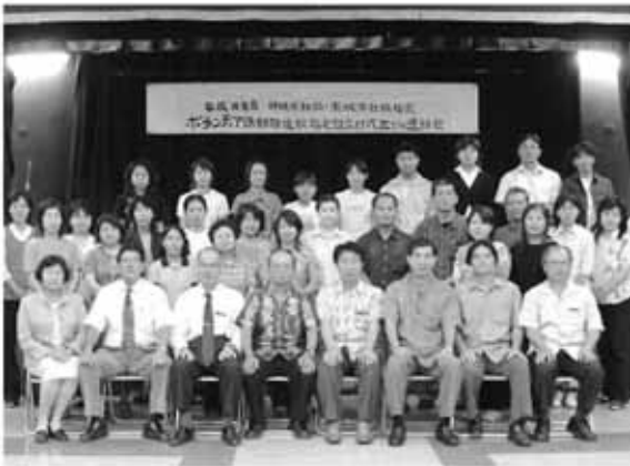
ボランティア活動推進校の皆さん

5月23日(火)南城市老人福祉センターにて、平成18年度ボランティア活動推進校に指定された市内30校の校長先生とボランティア担当の先生が参加して、指定証交付式が開催されました。