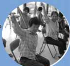
ミニエアロビ活動