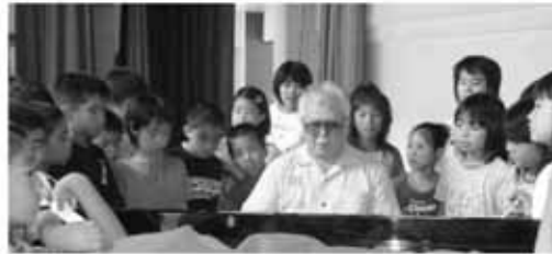
ピアノをひく比嘉さんをかこむ馬天小の4年生

と思いました。車いすの人のために、かいだんよりさかをふやしたほうがいいと思います。