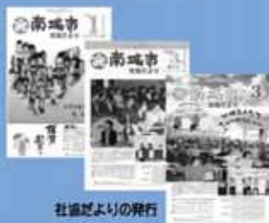
社協だよりの発行