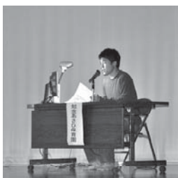
知念あさひ保育園