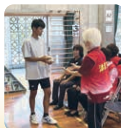
ミニデイスポレク大会