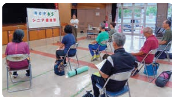
運動指導士からの説明を聞く