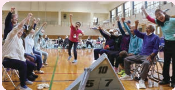
44チームが出場 参加者217名 「チャーがんじゅう賞」24名