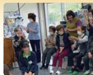
ミニデイサービス

生徒からは、職員の皆さんが、「地域の方のお手伝いやコミュニケーションを取ったり、裏でたくさん動いていることが分かりました」「お互いで助け合うことの大切さを学びました」などの感想があり、地域と福祉のつながりを実感する学びの時間となりました。