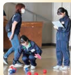
障がい者ふれあい交流会