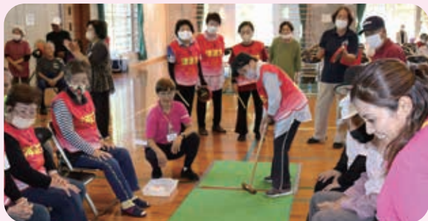
40チームが出場 参加者197名 「チャーがんじゅう賞」22名