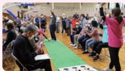
ビンゴ達成で30点獲得