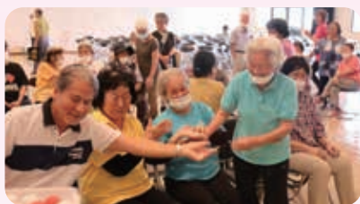
メンバー同士で讃え合う