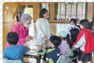
民生委員さんとお札数え体験