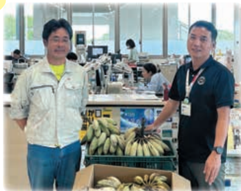
(株)スピーディーファーム様

場所: 南城市役所 社協内(東側1階) 曜日: 月～金曜日(祝日除く) 時間: 9時～17時 ☎: 917-5692 【10月～11月まで実績】 寄贈者20名/利用者28名