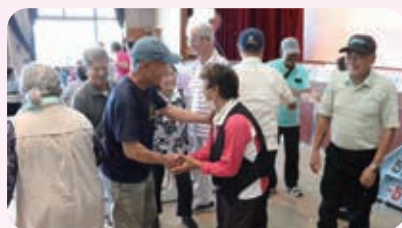
握手で仲良くゲームセット