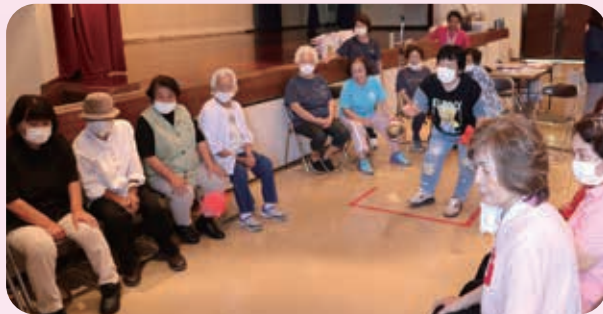
16チームが出場 参加者81名 「チャーがんじゅう賞」12名