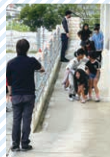
不安定な体勢での 歩行体験