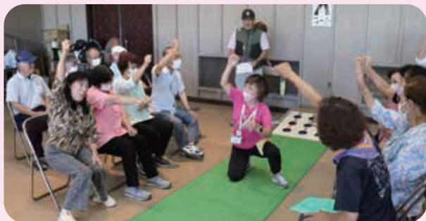
40チーム、199名が参加 90歳以上に送られる「チャーがんじゅう賞」19名