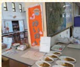
こども食堂ゆいゆい (富里公民館にて)

大里タクシー合同会社様より、こども食堂ゆいゆいさんへ募金のご支援をいただきました。