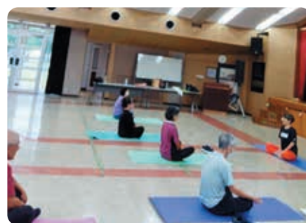
目標達成のために運動開始!