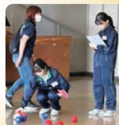
障がい者ふれあい交流会