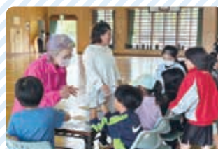
民生委員さんとお札数え体験