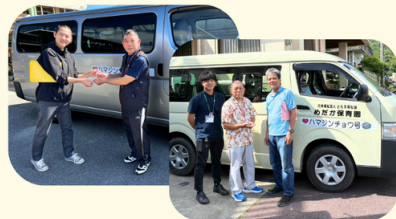
富祖崎(佐敷) 買い物移動支援の取組 富祖崎×めばえ保育園 富祖崎×めだか保育園