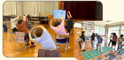
佐敷(佐敷) 自主体操サークル 立ち上げ