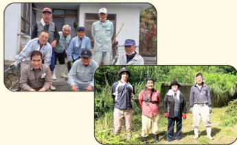
南風原(大里) 目取真(大里) 高齢者世帯の草刈り清掃