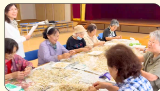
知名(知念) 知名×Aコープ マーミナ会 もやしのひげとり会