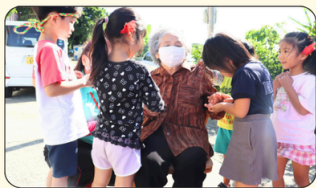
富山(玉城) ちびっ子見守り隊 富山×バンビ保育園