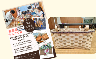
親慶原(玉城) ゆんたく会の開催 クラフトづくりなど