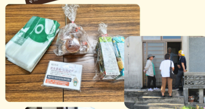
前川(玉城) 世帯訪問 声掛け訪問