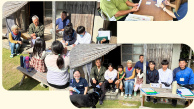
久高(知念) 久高小中学生による 高齢者宅訪問