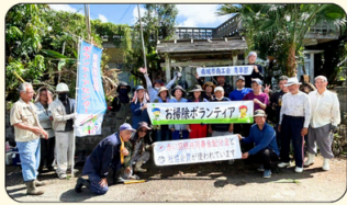
富山(玉城) 富山×商工会青年部×東雲の丘 世帯の草刈り等