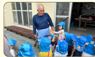
新里(佐敷) ちびっ子見守り隊 新里×めばえ保育園