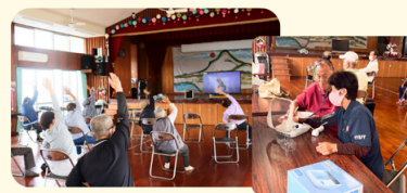
仲伊保(佐敷) 自主体操サークル 立ち上げ