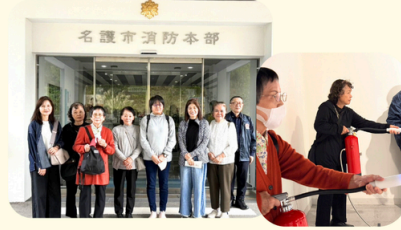
佐敷(佐敷) 防災研修センター にて体験型研修