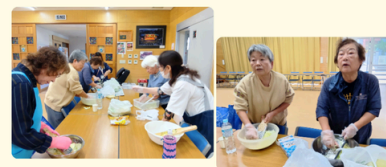
知名(知念) パイヤシリシリ の取組み