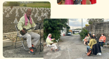
当間(大里) 庭先コンサート