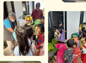
南風原(大里) ハロウィン訪問 南風原×おおざと保育園