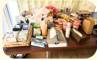
嶺井団地(大里) 被災世帯への支援 の取組み