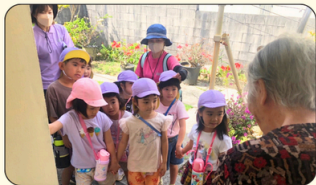
当間(大里) ちびっ子見守り隊 当間×松の実こども園