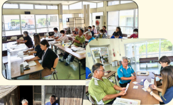
久高(知念) 久高×島の医療・福祉 関係者とACP勉強会