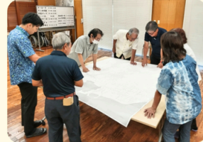
津波古(佐敷) 避難行動要支援者 名簿共有&訪問