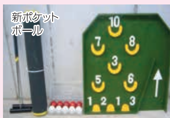
新ポケットボール