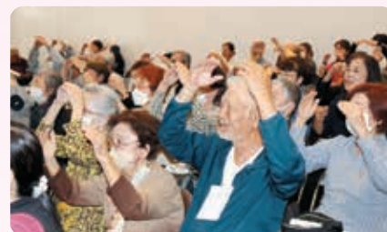
インターンシップの神奈川大学生も参加