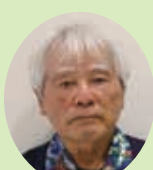
ちくぬ くにお 知念 國雄 前川