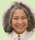
こはつ いずみ 古波津 泉 親慶原団地