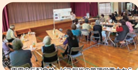
東雲の丘配食サービス担当の管理栄養士から、配食の特徴や栄養管理について学ぶ！