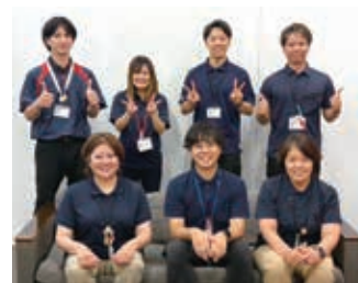
・コミュニティソーシャルワーカー ・生活支援コーディネーター 配置