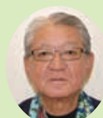
ながみ おさむ 長嶺 修 愛地