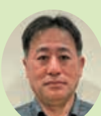
ほかま しんいち 外間 慎一 海野