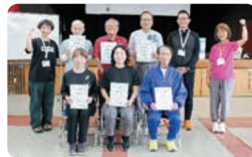
おつかれさまでした!

シニア健康塾を通じて、日々の運動の大切さや、体を理解して運動を行う必要性などを認識していただけたと思います。また、修了後も運動を続けていきたいとの嬉しい声も聞くことができました。ぜひ、これからも自宅や地域で運動を楽しんでください。参加してくださった皆様ありがとうございました。