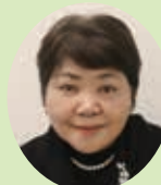
えもり ひとみ 江守 ひとみ 親慶原